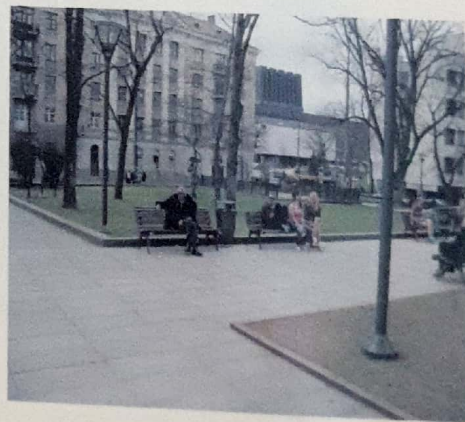
וילנה כיום - אפריל 2010