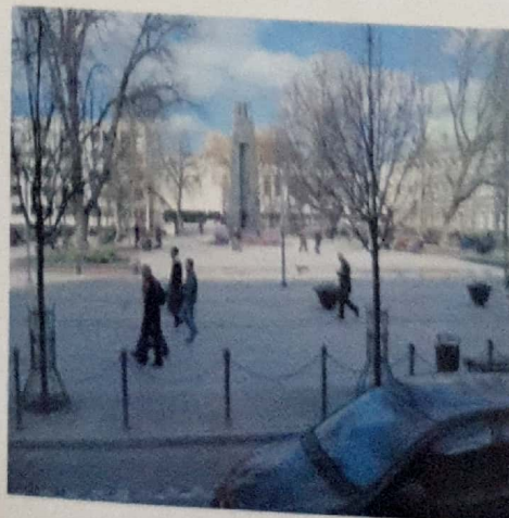
וילנה כיום - אפריל 2010