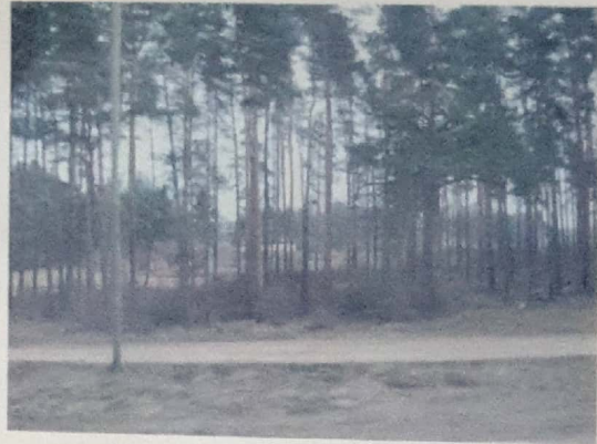
יערות הפרטיזנים - כך זה נראה כיום - אפריל 2010

לפני כשנתיים, אמא וסבתא שלי נסעו יחדיו לטיול שורשים בוילנה. הם ביקרו ב: יערות הפרטיזנים הם טיילו באיזור הגטו, וכמובן שביקרו באיזור בו סבתי התגוררה בילדותה. אמא וסבתא מספרות כי החוויה היתה מדהימה ומלאה ברגשות.