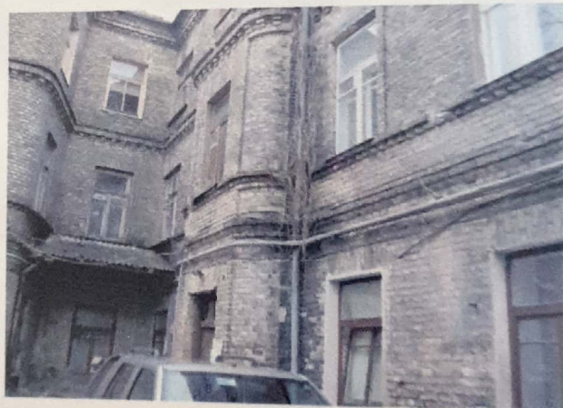
הבנין שבו סבתא שלי גדלה בילדותה - כך הוא נראה אחרי 53 שנה, אומנם מוזנח - אך עדיין קיים - אמריל 2010