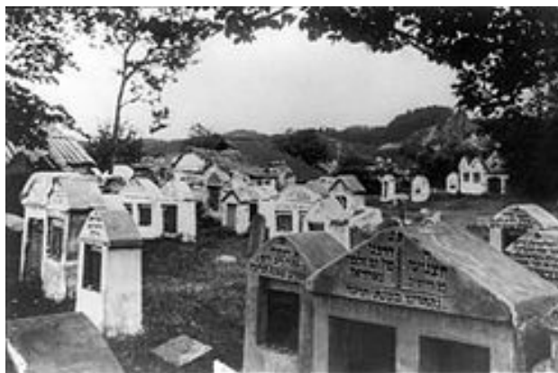
בית הקברות היהודי בוילנה בשנות ה-20 של המאה ה-20

קהילת וילנה נוסדה במאה ה-16 (בשנת 1543), כאשר המלך זיגמונד III נתן ליהודים כתב זכויות לפיו מותר להם לשכור ולקנות בתים בעיר ולסחור בה. כמו כן, מותר להם לייסד מוסדות ציבוריים הדרושים לקהילה. מאידך גיסא, לא נזכרת בכתב זכויות זה הרשות לעסוק במלאכה. את הזכות הזאת קיבלו כמאה שנה מאוחר יותר (ב-1633) מהמלך ולדיסלב IV. אולם, כתבי זכויות הם דבר אחד, והמצב בשטח הוא דבר אחר. למעשה, היו מאבקים מתמידים בין היהודים לבין העירוניים הנוצריים על זכויות המסחר, המלאכה ואזורי המגורים. היות והאצילים התנגדו לעירוניים - הם תמכו ביהודים, והמלך ניסה לפשר בין הצדדים. מה שהעירוניים לא השיגו בדרך של הגבלות מצד החוק - ניסו להשיג באלימות, בהתנפלויות על בעלי מלאכה יהודיים ועל בתיהם.