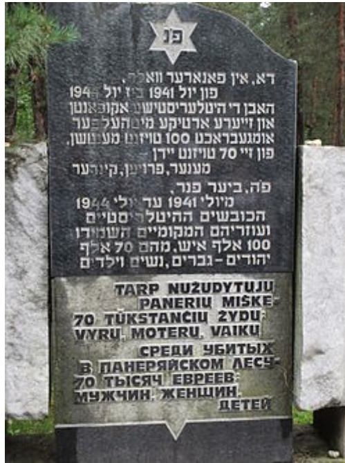
שלט הזיכרון ביער פונאר