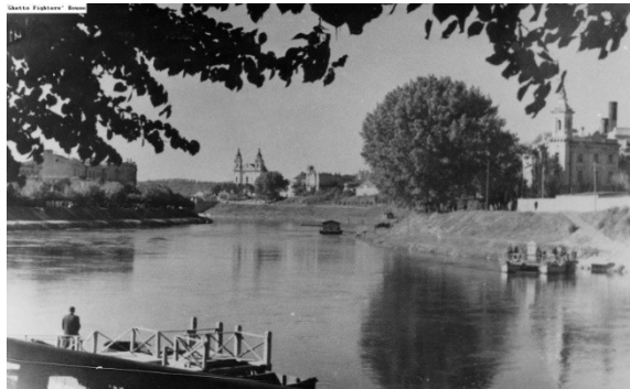
נהר הויליה בוילנה.

הרוסי ביולי 1944. מתוך כ- 80,000 יהודים שהיו בוילנה ערב השואה, נותרו 800 יהודים ב- 1944. לאחר השואה נעשה ניסיון לשקם במידת מה את הקהילה. כמו כן נוסד מוזיאון להנצחת השואה בוילנה, מזכרת עצובה לקהילת הפאר שהייתה ואיננה עוד.