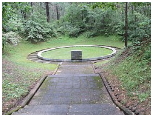
אחד מבורות ההריגה בפונאר