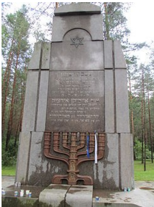
האנדרטה ביער פונאר

שְׁקֵט, שְׁקֵט, בְּנֵי נַחֲרִישָׁה כָּאן צוֹמְחִים קְבָרִים הַשּׁוֹנְאִים אוֹתָם נִטְעוּ פֶּה מִעֲבָרִים אֶל פּוֹנָאר דְרָכִים יוֹבִילוּ דֶּרֶךְ אֵין לְחֹזֵר לְבָלִי שׁוֹב הֶלֶךְ לוֹ אָבֵא וְעַמּוֹ הָאוֹר